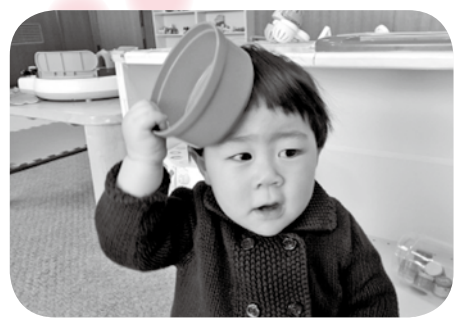
じいちゃん、ばあちゃん たくさん遊んでくれて ありがとう。