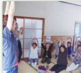
不知火町 浦上・新村区