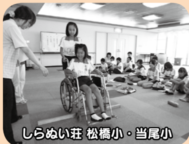
しらぬい荘 松橋小・当尾小