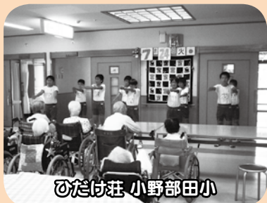
ひだけ荘 小野部田小

参加者は、福祉用具の使い方を学んだり、介護の体験を行いながら、入所者の皆さんとの交流を深めました。