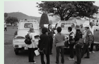
オリエンテーション (活動場所・内容・注意事項の説明)