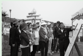
ニーズマッチング (活動とボランティアを調整します)