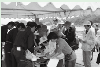
ボランティア受付 (希望される活動を聞きとります)