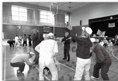
障がい者福祉スポーツ大会