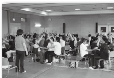
サロンレクサポーター フォローアップ講習会