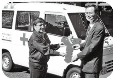
10月29日、日赤熊本県支部より日赤宇城市地区へ災害救援車が配備されました。この車両は赤十字活動の推進と周知、地域福祉の増進、また災害等の発生時、救援物資の輸送等に活用されます。