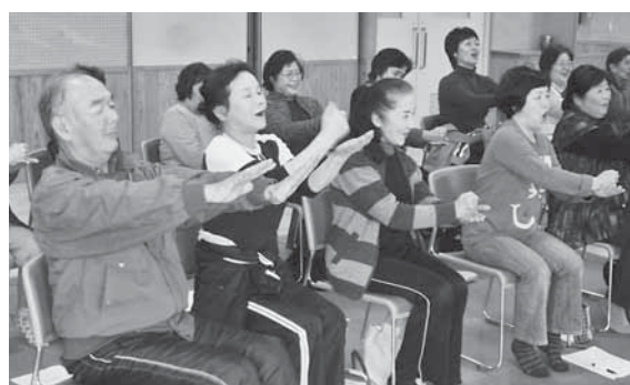
サロンレクサポーター養成講習