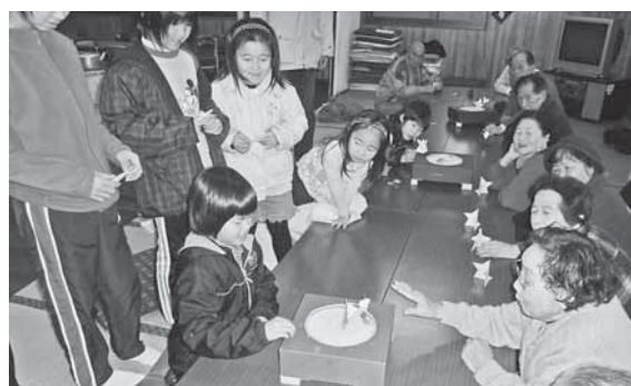
福祉会での世代間交流