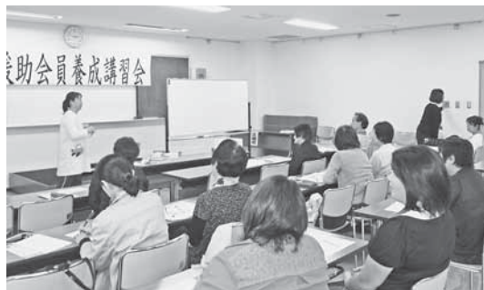
利用会員（子どもを預ける方）は随時募集しています。

講習会には11の方が参加し、『保育の心』『子どものお世話と遊び』『子どもの健康と安全』など計6時間にわたり講習を受けられました。参加者の方は「改めて子どもについて様々な視野から学ぶことができ、これからの活動に生かしたいと思います。また、利用会員の方々が安心してお仕事ができる環境づくりに心がけ、お手伝いができる事をうれしく思います。」と話されていました。