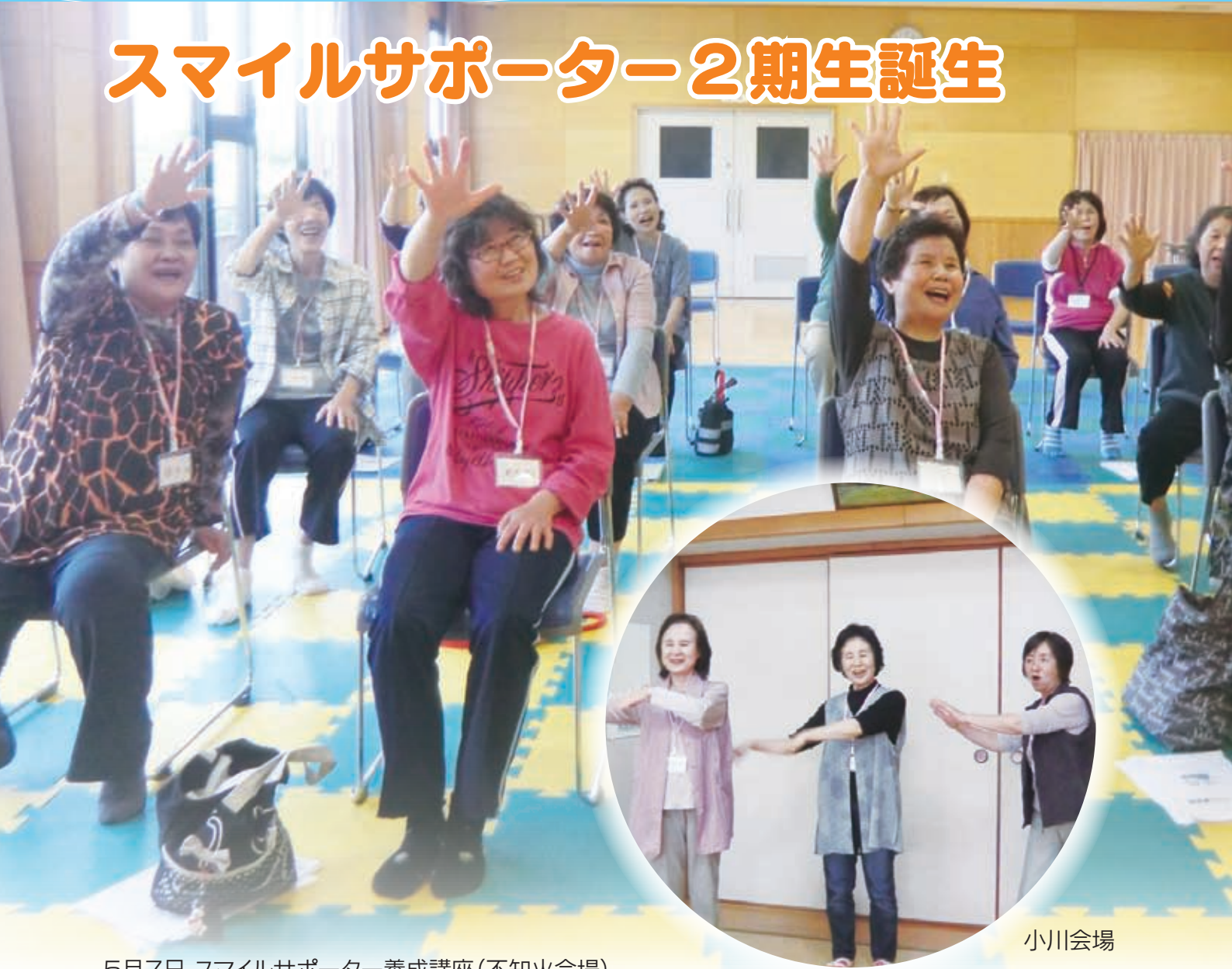
5月7日 スマイルサポーター養成講座(不知火会場)