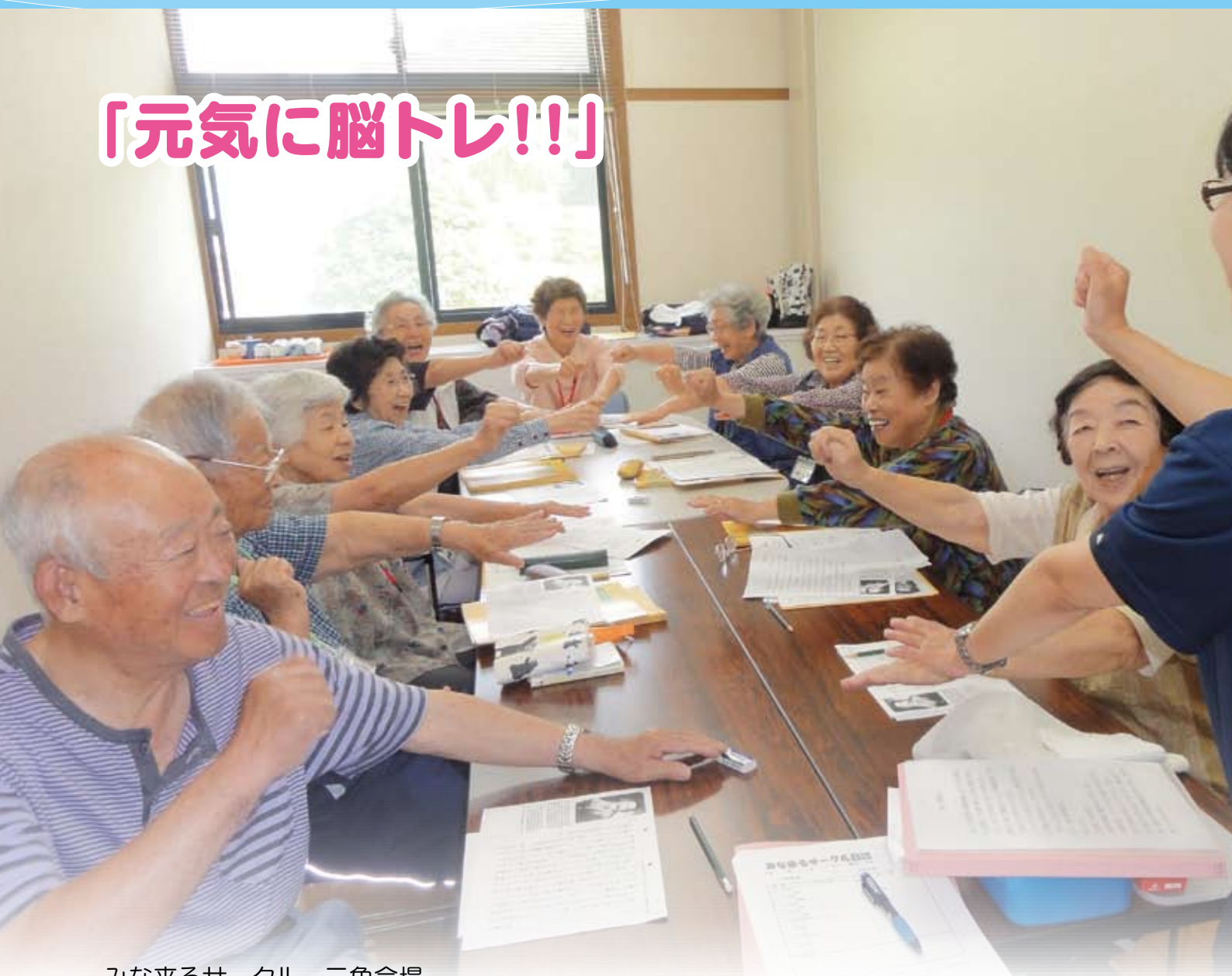
みな来るサークル 三角会場