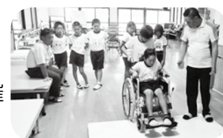
ワークキャンプ事業