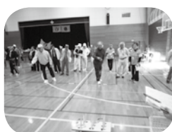
障がい者スポーツ大会