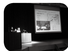
地区福祉会リーダー研修会