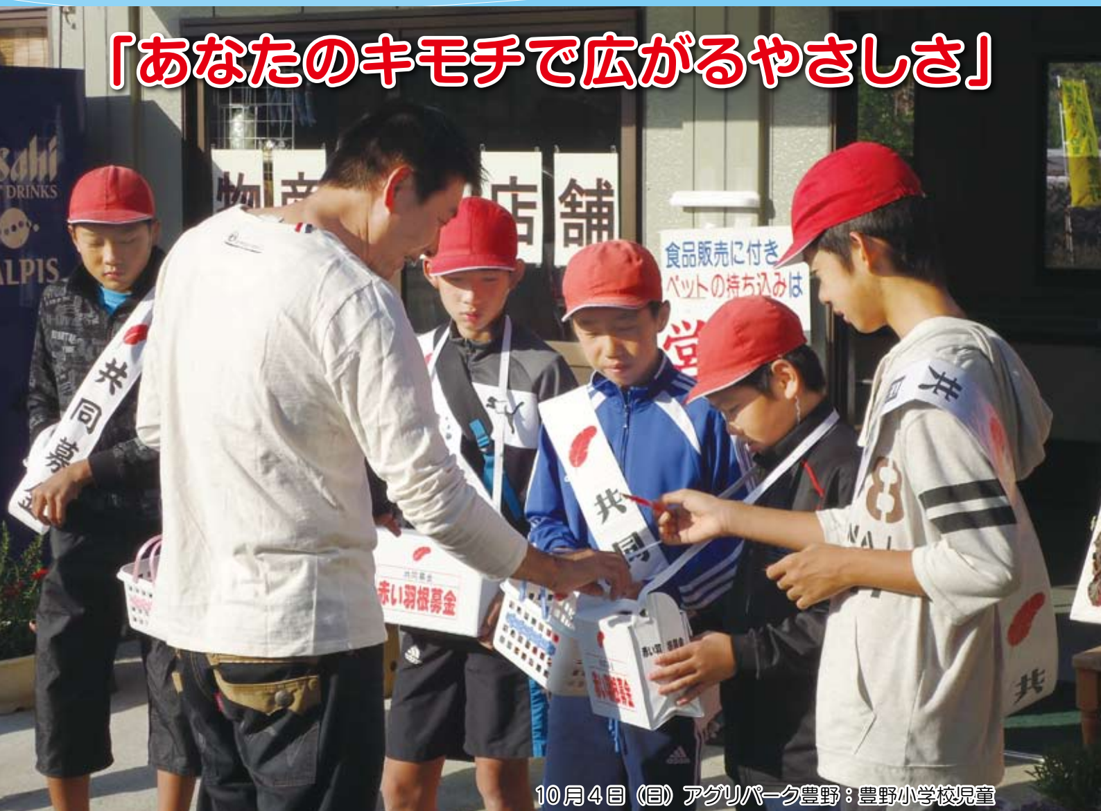
10月4日(日) アグリパーク豊野: 豊野小学校児童

10月1日から共同募金運動がスタートしました。スタートに伴い宇城市内10カ所の店舗にご協力いただき、小中学生、社協役職員、ボランティアの皆さんで街頭募金運動を展開しています。募金活動にご協力いただき、ありがとうございました。