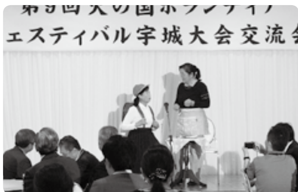
ボランティアフェスティバル交流会

劇団うきうきは身近な福祉問題を題材として劇を演じるボランティアグループです。演劇やボランティアに興味のある方はお気軽にご連絡ください。