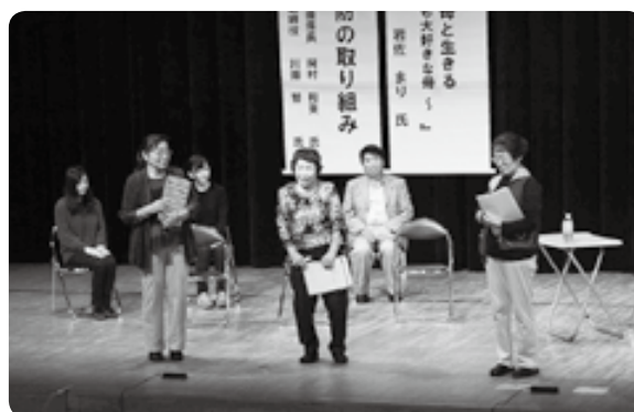
認知症市民フォーラム