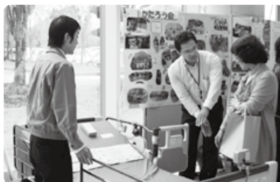
展示・体験コーナー