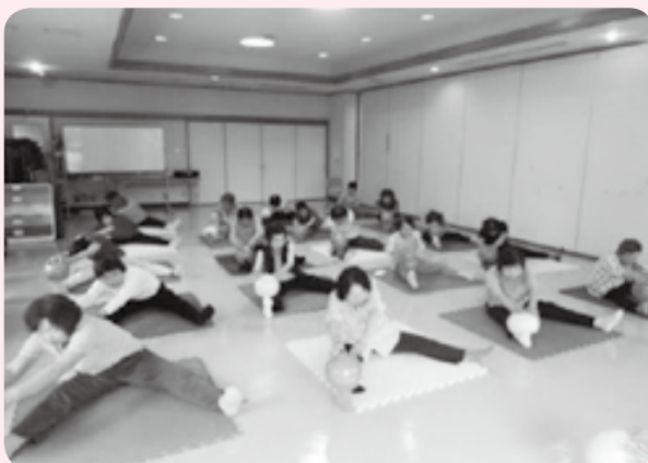
セラボールを使った体操

防に努めるため、各町で体力維持に効果が期待できる体操や、認知症予防に繋がる脳のトレーニングも行っています。地域でいつまでも元気に暮らせるように、介護予防事業推進員が全力で取り組んでいます。28年度もどうぞよろしくお願いいたします。