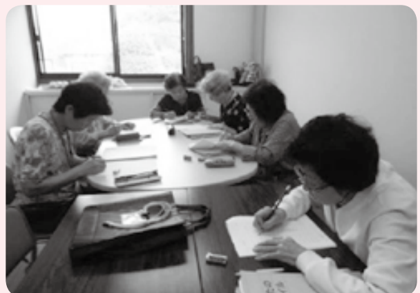
脳のトレーニング（簡単な計算問題）