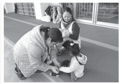
援助会員が保育園のお迎え