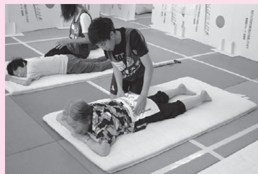
体のケアを行う日本体育大学

今後センターでは、仮設住宅入居者への友愛訪問や集会所でのお茶会等を実施していく予定です。