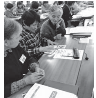
中央がサポーター