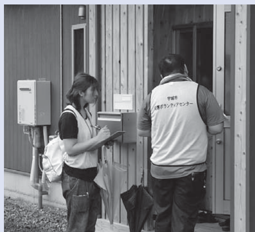
仮設住宅での聞き取り訪問

生活復興支援ボランティアとして県内の方を対象に事前登録を受付しています!! 詳しくはホームページ (URL: www.shakyou-uki.jp ) 又は下記までお問い合わせください。