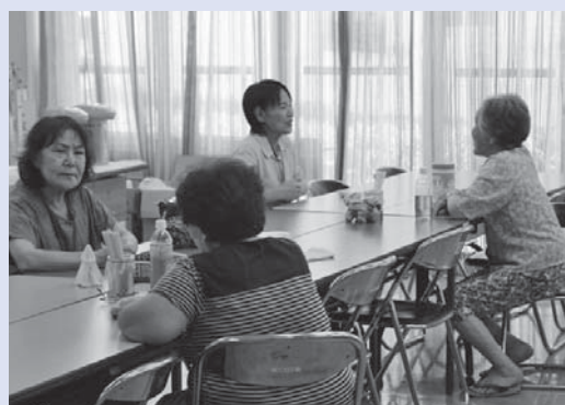
「傾聴ボランティア宇城」による避難所での傾聴活動