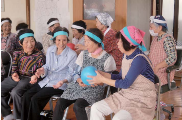
ふれあいいきいきサロン活動

このような現状の中、住み慣れた地域で誰もが安心して暮らしていくためには、人と人がつながり、ともに支え合う地域づくりが必要です。地域に住んでいる皆さんが地域を見つめ、地域の課題をとらえ、課題解決に向けて意見を出し合い、健康で活力ある地域づくりをめざし活動する自治組織が地区福祉社会です。行政区を単位に、それぞれの地域に応じたかたちで住民が主体となって取り組んでいただいています。