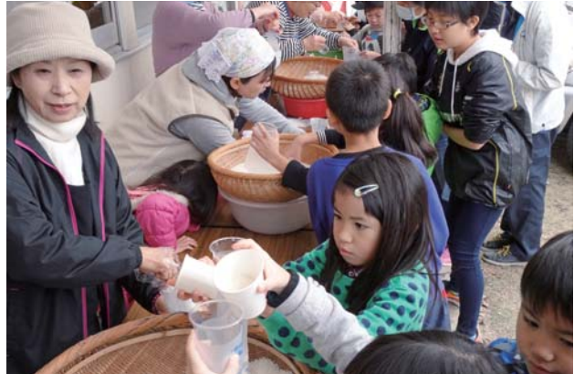
地域福祉活動(炊き出し訓練)