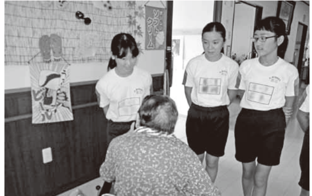
豊洋園 高齢者と交流