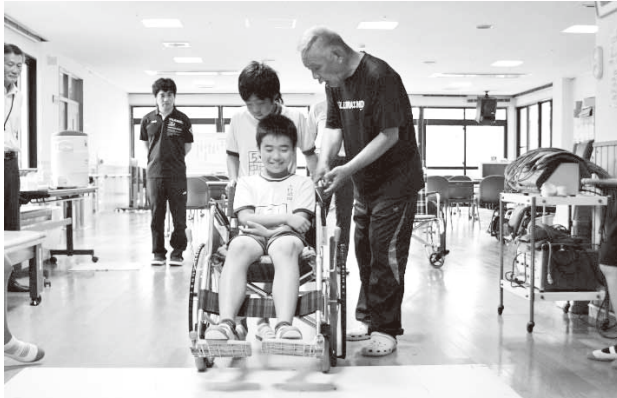
ひだけ荘 車いす体験

7月24日から8月25日の間、宇城市内の小学生・中学生・高校生を対象に、特別養護老人ホーム豊洋園・蕉夢苑・しらぬい荘・ひだけ荘・水晶苑、障がい者支援施設清香園で開催し、福祉用具の使い方や、衣服の着脱の仕方、食事介助等の体験を通して知識と技術を学び、利用者の方と、レクリエーションなどで交流を深めました。