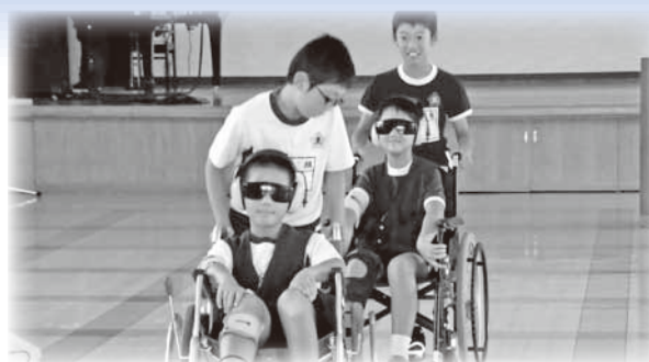
しらぬい荘 疑似体験・車いす体験