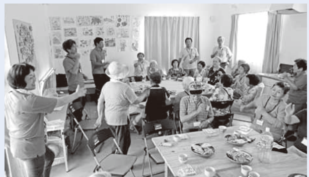
仮設団地のお茶会の様子(コミュニティづくり)