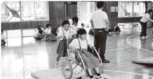
学校での福祉教育に