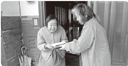
高齢者の見守り活動に