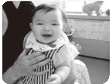
さくらんぼの笑顔です。