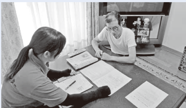
みなし仮設への訪問(見守り活動)

宇城市では生活支援相談員11人が、仮設住宅やみなし仮設住宅等で生活されている方を訪問し、必要なサービスや相談・各種調整等を行っています。また、仮設住宅での「どきゃん会」などのサロン活動を通じて、コミュニティづくりをお手伝いしています。今後は、在宅で支援が必要な方々への訪問、相談活動も行っていきます。お気軽にご相談ください。