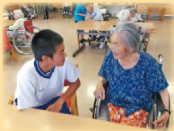
豊洋園 ふれあい活動