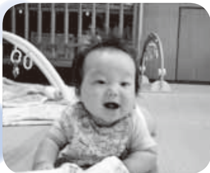
さくらんぼの笑顔です。