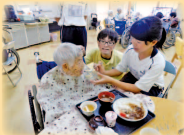
蕉夢苑 食事介助体験