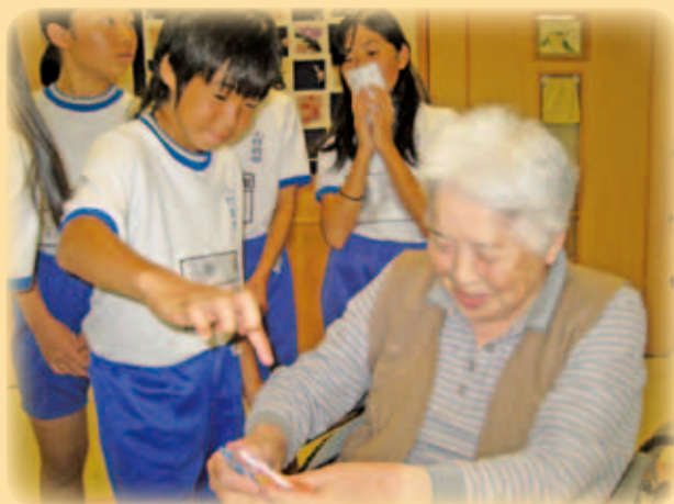
ひだけ荘 ふれあい活動