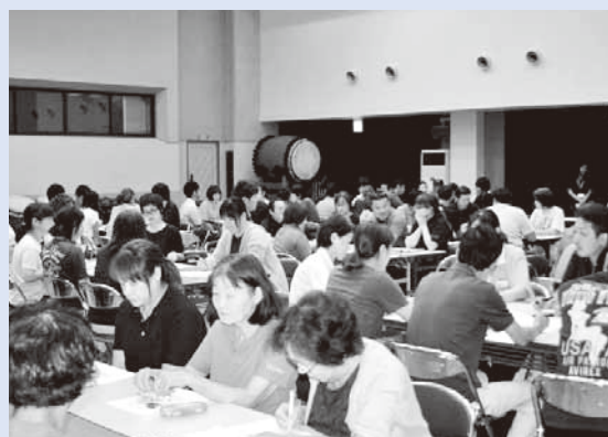
他事業所との意見交換の様子

8月21日に『宇城市における地域包括ケアシステム』についての研修を実施し、介護保険事業所より94人の参加がありました。最初に、市高齢介護課より『介護保険の改正点・動向について』『宇城市の現状・課題と地域包括ケアシステムでの介護保険事業所の役割と自立支援に向けた視点について』の説明がありました。その後グループに分かれて意見交換を行いました。参加者より「自立支援の重要性を改めて感じた」「自助力をいかにアップするか、そこを意識して仕事したい」などの声が聞かれました。