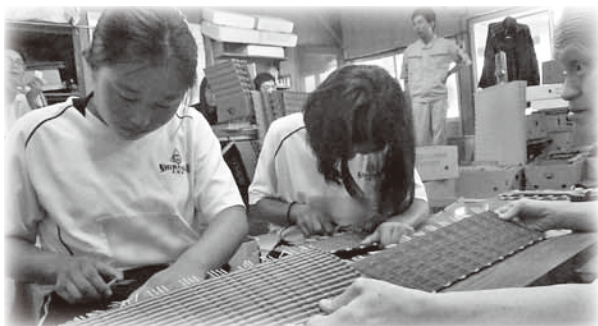
清香園 物作り作業

2日間のワークキャンプ事業に参加させていただき、初めは上手に話せるか楽しんでもらえるかなどとても不安でしたが、「出来るだけ利用者さんとたくさん話し、その人の良い所を見つける」という目標を立てて活動しました。私は機能班の皆さんと歌ったり、体を動かしたりしましたが、利用者様1人ひとりととても元気が良く、優しく話しかけてくださりうれしかったです。特に利用者様の笑顔にはとても魅力を感じ、見ていだけで私達も笑顔になりました。紙芝居も読ませていただきました、耳を傾けてくださり、利用者様の心の温かさを身に試みて分かりました。初めての障がい者対象のワークキャンプに参加し、とても良い経験をさせていただき、少しでも障がい者に対する偏見が減ればいいなと感じました。2日間本当にありがとうございました。