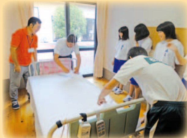
水晶苑 シーツ交換体験

7月24日から8月25日の夏休み期間に、福祉体験活動としてワークキャンプを開催し、市内の小学校・中学校・高校の児童生徒約200人が参加しました。参加者からは、「日頃できない体験がいろいろできた」「高齢者、障がい者の方への接し方がわかったので今後に生かしたい」などの感想が聞かれました。