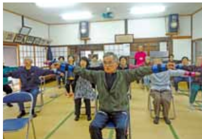
三角町浦地区福祉会

週1回地区の公民館などに集まり、いきいき百歳体操などを行い、住民主体の通いの場を充実させ、住み慣れた地域で自立して生活できるよう支援していくことを目的としています。現在、通いの場は市内33か所で開催されており、心身機能の維持向上に効果がでています。