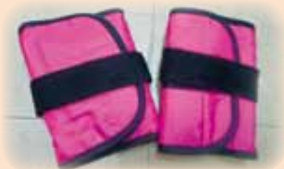
百歳体操のおもり