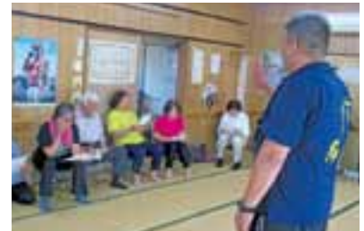
松橋町島地区福祉会 ●毎週水曜日14:00～ 島農業研修施設

今回、感謝状と記念品を受け取られた46地区です。一部の地区は、平成26年度のモデル事業から取り組まれています。