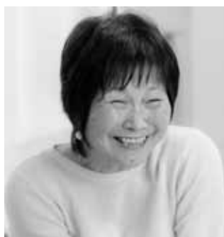
テレビ等で大家族の日常が紹介された大きな話題に、育児・家事の一方、数々の著作や800回を超える講演と、多忙な日々でも毎日笑顔いっぱい。