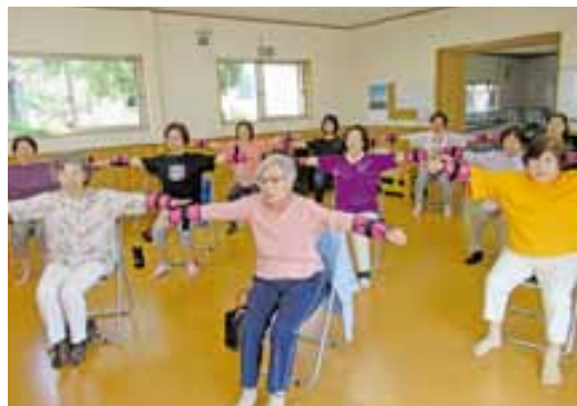
小川町三ツ丸地区福祉会 ●毎週月曜日10:00～ 三ツ丸公民館

参加者は「毎週楽しみに参加しています」「頑張っ体操をしています」と話していました。