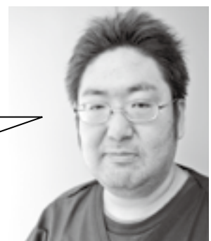
吉永歯科医院 院長 広島出身 カープファン

「口は命の入り口、心の出口」という言葉があります。文字通り、口から食べ物を食べ、言葉を発することで自分の気持ちを伝える、という意味の言葉です。生活する上で基本的なことのように思えますが、高齢の方にとっては当たり前の事ではありません。いつまでも自立した生活を送る条件の一つに自分の口で食べるということがあります。そして、自分の口で食べるためには、口の健康を維持することが不可欠です。しかし、その健康が維持できていない事例を数多く経験してきました。まだ、訪問歯科診療の認知度は高くありません。口から健康に食べる事を続けて欲しい、そのお手伝いとして訪問歯科診療の利用の普及啓発に努めていく必要があります。