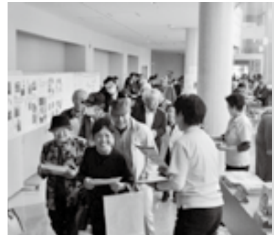
認知症予防啓発のコーナー