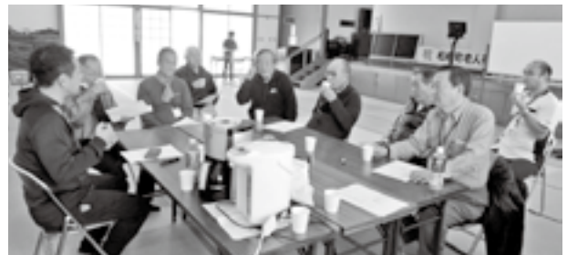
※運動後の「コーヒータイム」で談笑(趣味の話に花が咲きます)