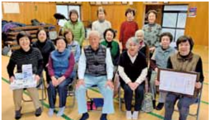
小川町北小野地区福祉会への贈呈式