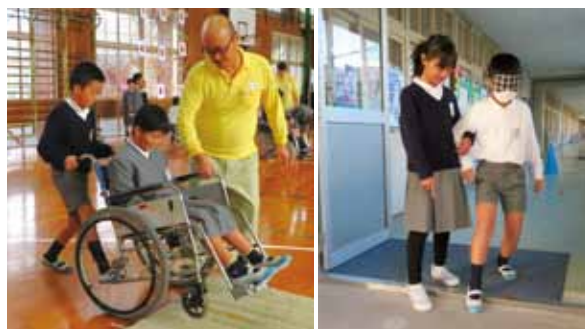
※昨年の体験風景です。