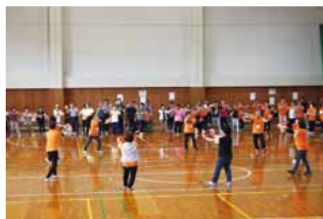
※昨年の障がい者スポーツ大会の様子です。