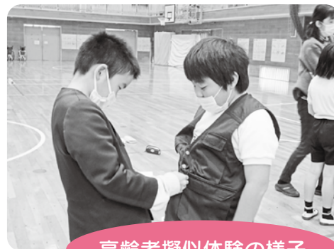
高齢者疑似体験の様子

児童は「車椅子を何も言わずに押されるとこわい、押しま すよと言ってもらえると安心する」「楽しかったし、どうい う風に車椅子を押せばいいか分かりました」「高齢者の方に優 しくしたい」などの感想が聞かれました。