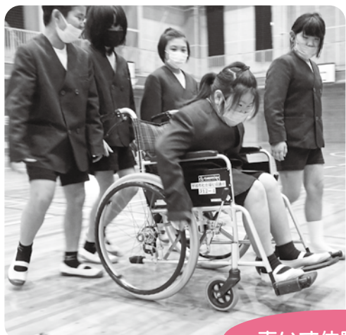
車いす体験の様子