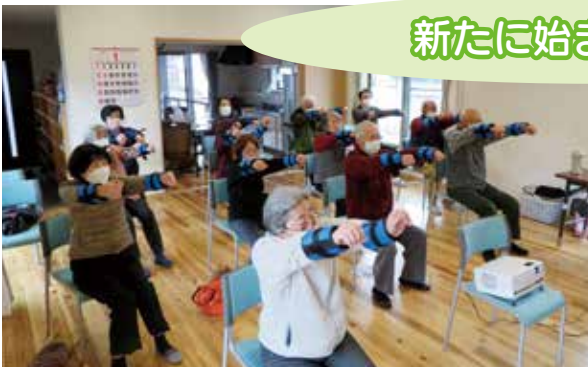
小川町中町地区福祉会 毎週金曜10:00～ 小川刈萱館