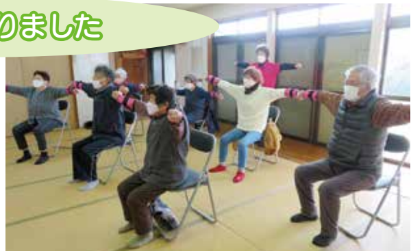
小川町河江地区福祉会(三軒屋会場) 毎週木曜9:30～ 三軒屋公民館