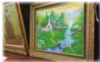
切り絵、書道、パッチワーク、油絵の展示