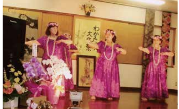
普段見慣れないフラダンスの華やかな衣装に皆さん感激されました。