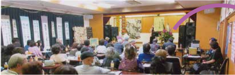
ステージの装飾も手作りで、両端には花、背景には帯や着物が飾られています。