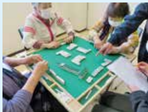
健康マージャン教室