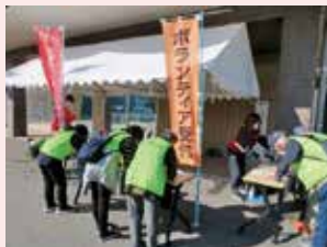
災害ボランティア