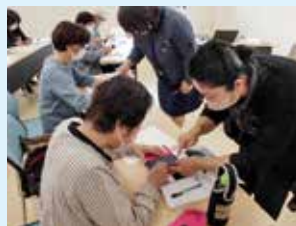
スマートフォン教室