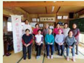
地域づくり通いの場