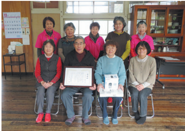
豊野町 南山崎地区福祉会 毎週月曜日 午後1時 南山崎公民館

豊野町南山崎地区では百歳体操を始められて半年以上経ちましたので、感謝状と記念品を贈呈しました。