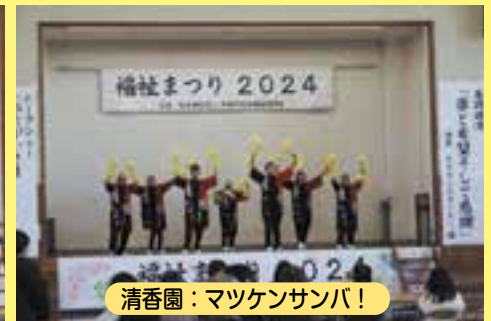
清香園：マツケンサンバ!