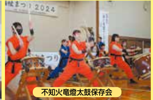
不知火電燈太鼓保存会