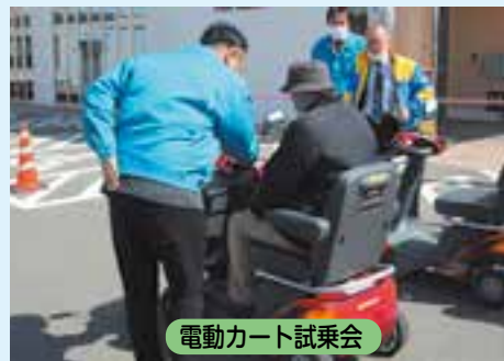
電動カート試乗会