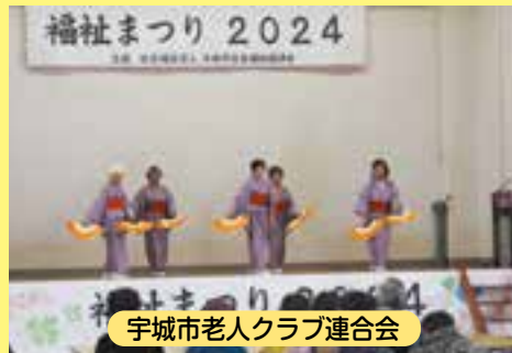
宇城市老人クラブ連合会