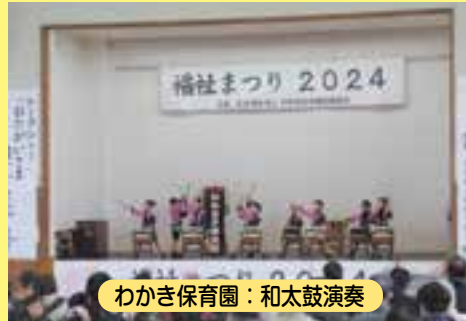
わかき保育園：和太鼓演奏