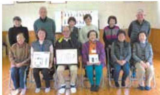
小川町 河江地区福祉会 毎週水曜日 午前10時半 河江公民館

皆さんも、地域の公民館等で筋力トレーニングを行いませんか。皆さんの地区へご説明に伺います。興味がありましたら下記までお問い合わせください。