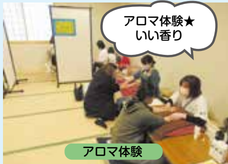
アロマ体験★ いい香り