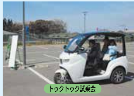
トゥクトゥク試乗会