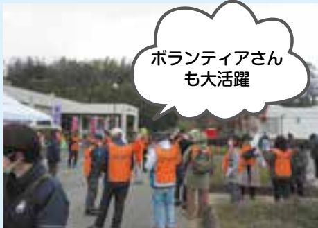
ボランティアさん も大活躍