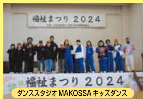
ダンススタジオ MAKOSSA キッズダンス