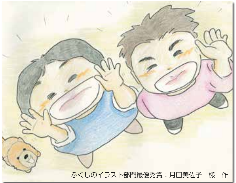
ふくしのイラスト部門最優秀賞：月田美佐子 様 作