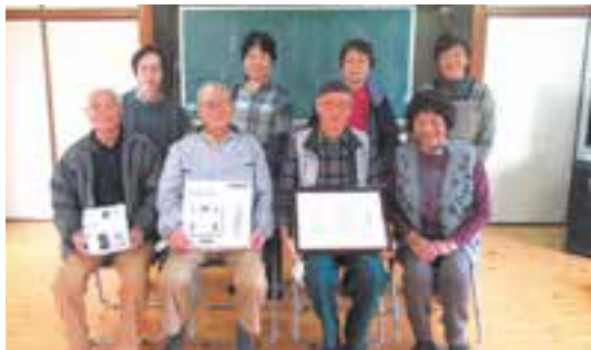
三角町 矢崎地区福祉会 毎週火曜日 午後1時半 矢崎集落センター

百歳体操を始められて半年以上経ちましたので、感謝状と記念品を贈呈しました。今後も百歳体操を通していきいきと交流を深めてください。