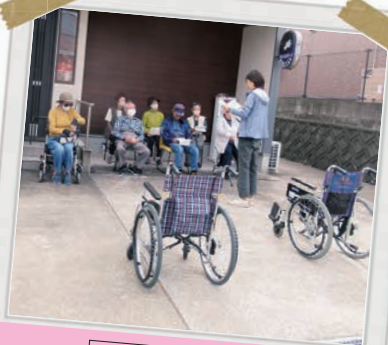
御領6区サロン 車イス体験!!