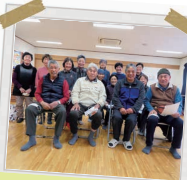
古保山サロン 百歳体操12年目!