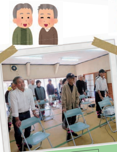
浦上・新村サロン 百歳体操体験中!!