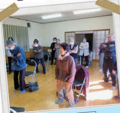
打越サロン 百歳体操のあとは健康マージャン!