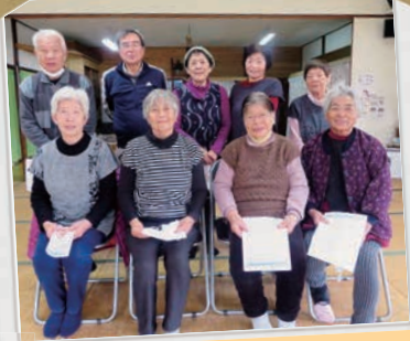
上中内サロン 体力測定後にハイチーズ!!