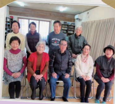
上系石サロン 百歳体操や脳トレなど色々な活動をしています!