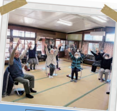
表南小川サロン 認知症予防に「脳トレ体操」!